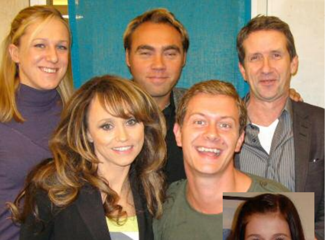
Stiftelsen MinStoraDags ambassadörer Kajsa Bergqvist, Johan Ernst Nilson, Martin Timell, Nanne Grönvall, Tobbe Blom och Amy Diamond