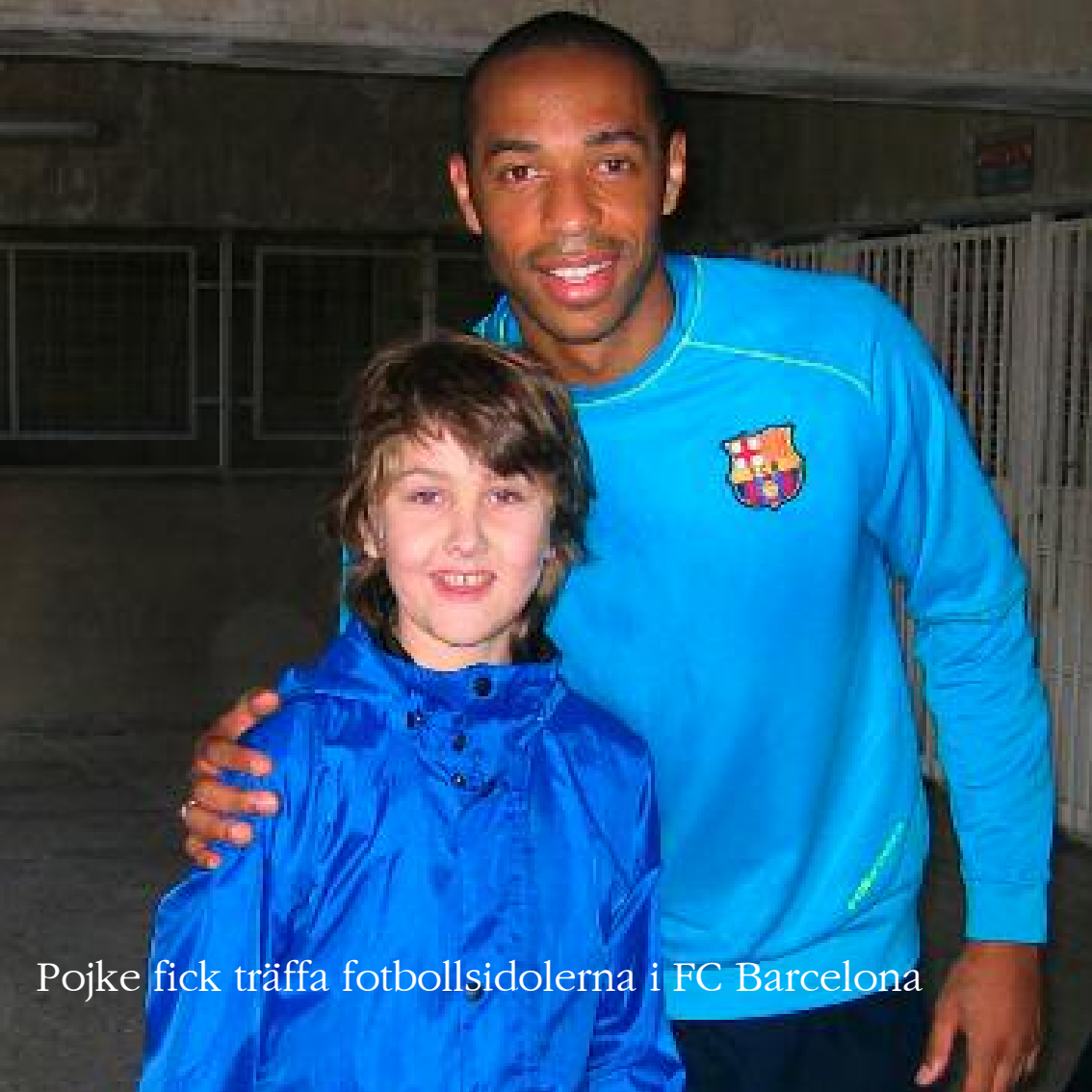
Pojke fick träffa fotbollsidolerna i FC Barcelona